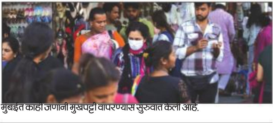
मुंबईत काही जणनी मुखपट्टी वापरण्यास सुरुवात केली आहे.

जगातील करोनाच्या उद्रेकाच्या पार्श्वभूमीवर राज्यात देखील